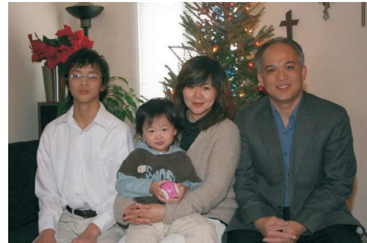
Sima ar vīru un dēliem

Reizi nedēļā budisti dodas uz templi. Tur viņi ziedo naudu, ēdienu vai drēbes – kas nu kurā gadījumā tempļa iemītniekiem vairāk vajadzīgs. Kad viņi ir atnesuši savu ziedojumu, tad mūki pateicībā var aizlūgt par mirušajiem tuviniekiem, lai arī tiem labi klātos. Aizlūgšanas gan notiek svētajās valodās – bali vai sanskritā, tā nu klausītāji parasti neko daudz par aizlūgšanu saturu nezina.