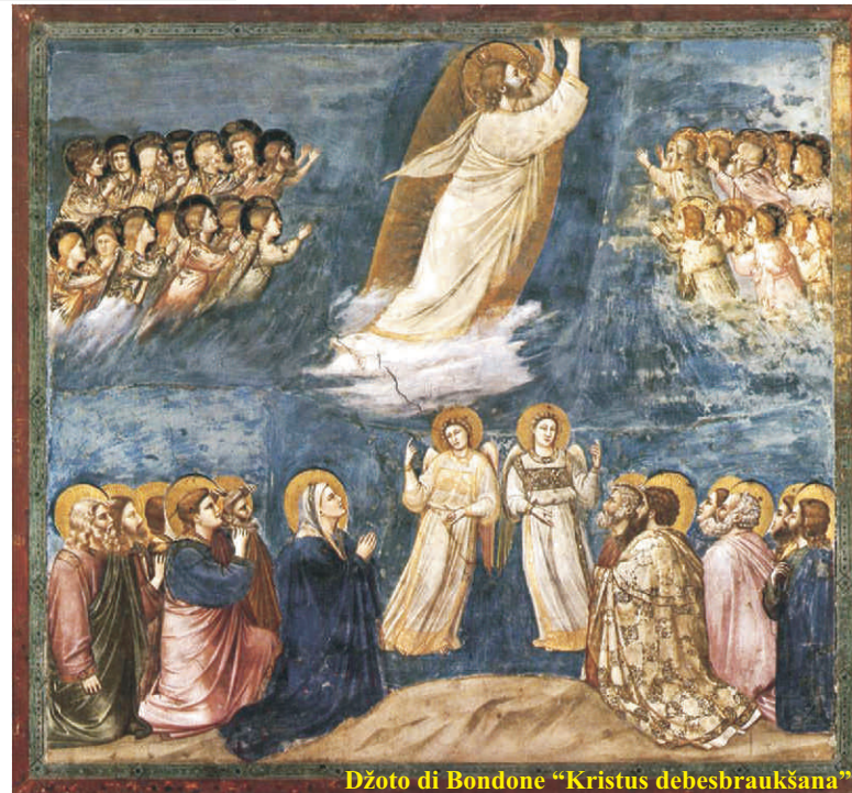
Džoto di Bondone "Kristus debesbraukšana"