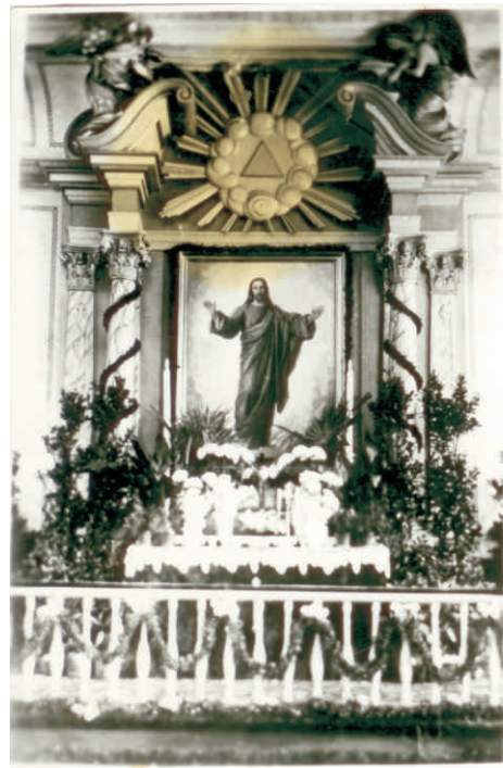
Bīkeru baznīcas altāris, 1933. gads.