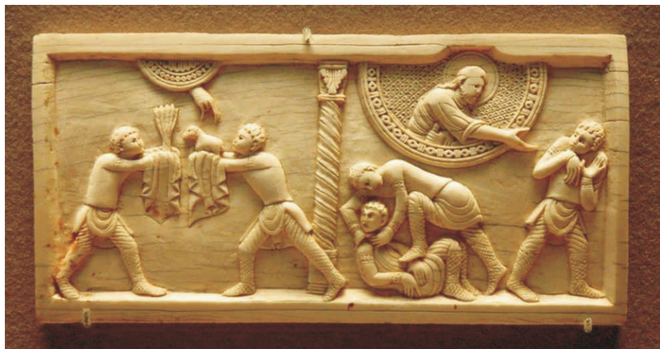
Kains un Ābels. Zilonkaula panelis no Salerno katedrāles (Itālijā). Nezināms autors, ap 1084. g. (tagad Luvrā, Parīzē)

Un Kains ļoti saniknojās, un viņa seja pārvērtās. Tas Kungs sacīja Kainam: